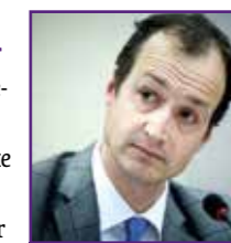
Draait Wiebes accijnsverhoging terug?