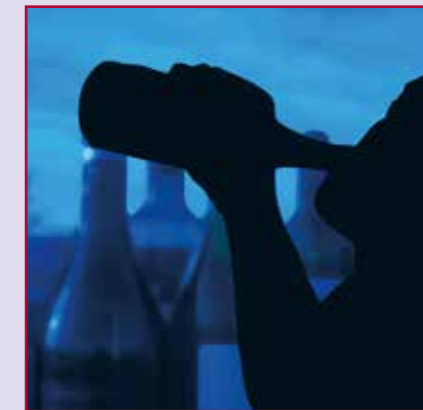
Nalevingspercentages (95% BI) alcoholverkoopkanalen

supermarktkanaal vervaardigde uitleg van de regels. Die uitleg gaat mogelijk verder dan uit de wet voortvloeit, maar we raden toch aan deze te volgen. In het belang van het behoud van het slijterskanaal als exclusief verkoop-punt voor verkoop van sterke drank, roept de voorzitter van de SlijtersUnie op om ook in de toekomst strikt toe te zien op naleving van de leeftijdsgrens van 18 jaar. De SlijtersUnie wil voorkomen dat het supermarktkanaal straks beter blijkt te presteren dan het slijterskanaal.