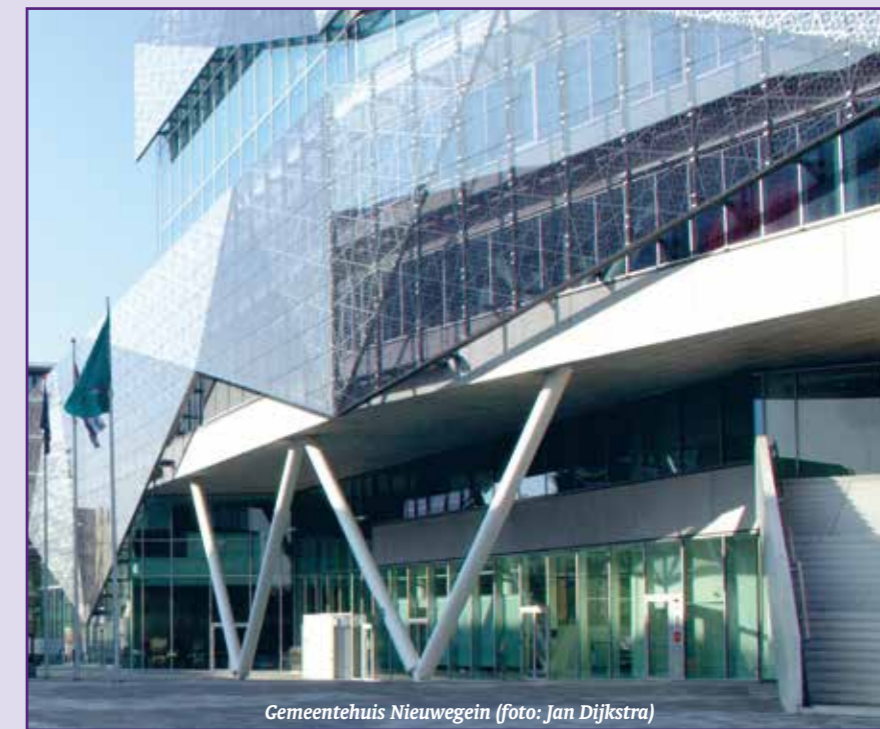
Gemeentehuis Nieuwegein

openbare-orde- en zedelijkheidsargumenten", aldus de rechter in Utrecht. Deze nieuwe uitspraak geeft een handvat om de pilot landelijk aan te pakken. Op basis hiervan zullen gemeenten hun ingenomen standpunt moeten herzien.